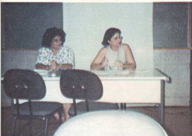
IV - Seminário Nacional de Estudos e Pesquisas - UNICAMP

O curso apresenta duas grandes linhas de pesquisa, a saber: 1- A Escola e a Construção do Conhecimento, que comporta e orienta os estudos das temáticas: a) Linguagem e Comunicação; b) Educação Científica e Tecnologia. 2 - Educação e Sociedade, que comporta os estudos das temáticas: a) História, Sociedade e Educação no Brasil; b) Políticas Públicas e Educação; c) Participação e Cidadania.